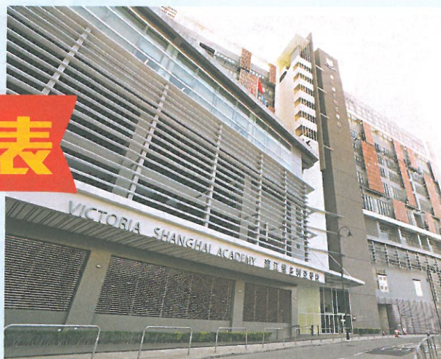
• 滙江維多利亞學校